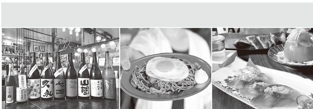
日本酒 常時12種類ほどご用意しております