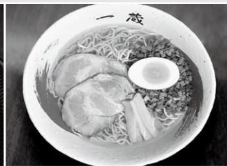
鮭ぶしらーめん 900円