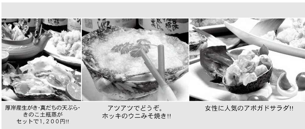
厚岸産生がき・真だちの天ぷら・ きのこ土瓶蒸が セットで1,200円!!