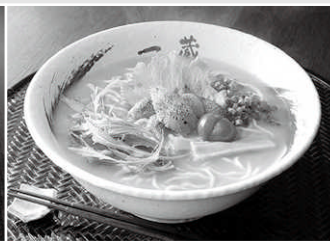
オリジナルうにらーめん 1,400円