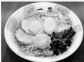
ホタテらーめん 1,200円