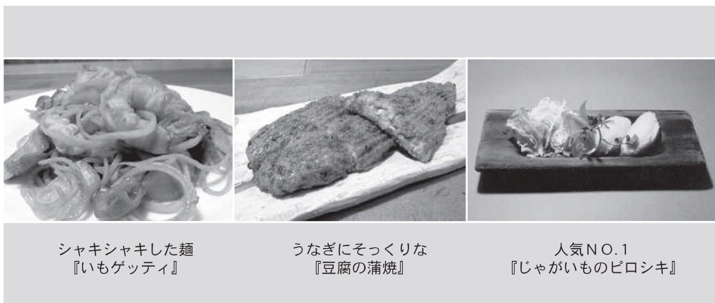
シャキシャキした麺 『いもゲッティ』