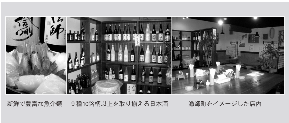
新鮮で豊富な魚介類

一条通り沿いで昨年12月にオープンした番屋は、漁師町を想わせる雰囲気の中、旬の新鮮な魚介類をはじめ豊富な品揃えが人気の居酒屋。 食材のこだわりだけでなく、厚岸産・サロマ産の牡蠣食べ比べや、この店定番の夕チは、天ぷら・軍艦巻き・刺身・バター焼とメニューにも一工夫しお客を飽きさせない。 また、料理を提供する店長は、長年寿司職人をしており居酒屋では珍しく本格的な握り寿司を楽しむことができる。 複数で来店されるお客さん一人ひとりを満足させる品揃えをコンセプトに、仕入れやメニュー、調理にこだわったこの店は、まさに店主自らが行きたい理想の居酒屋と言える。 そしてこの料理を引き立てるのが、定番の久保田・八海山をはじめ9種10銘柄を常時取り揃える日