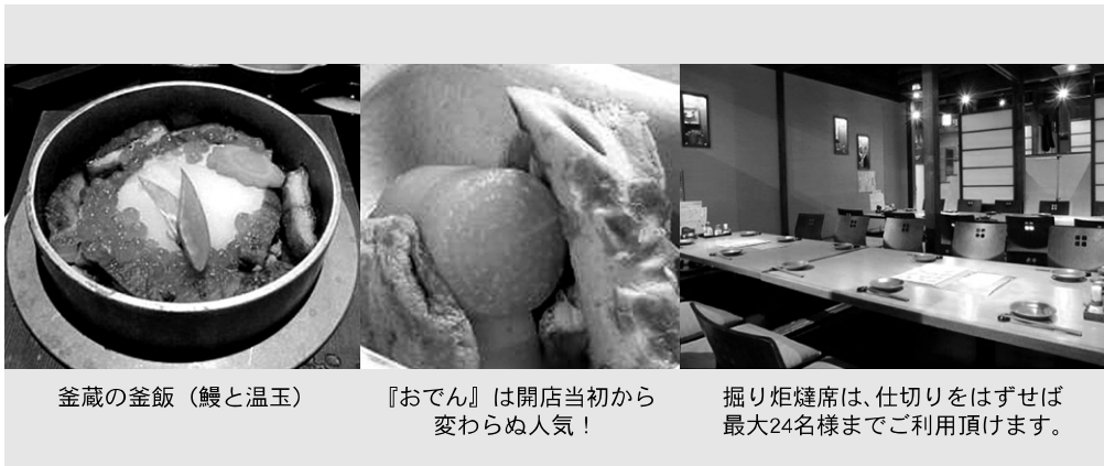
釜蔵の釜飯(鰻と温玉)