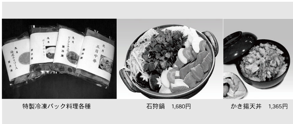
特製冷凍パック料理各種

創業明治40年、今年で103年を迎えた花月の直営店。和食を始め洋食、中華などメニューも豊富で、家族連れから接待まで幅広く利用できるお店です。 店内には小上がり、掘りこたつ、個室があり、希望によっては個室を椅子席に変更することも出来ます。また、お好みで注文できる天ぷらカウンター、寿司カウンターも人気の席です。 かぶとでは老舗の料理を気軽に味わえるとあって、地元客はもちろんのこと、道内外のファンも多く、昼夜店内は賑わっています。ランチメニューは6種類の中から2品をチョイスする料理に茶碗蒸し、デミコーヒー付きのミニ丼セット945円、寿司セット1050円、洋食ランチ1260円、ライスの上には数種類の具を並べた野菜ポークカレー1155円をはじめ各種(ランチ11時30分~15時00分)。 通常メニューの人気商品はかぶと弁当1680円、かき揚げ天井1365円、ミニ会席2625円、特製味噌の石狩鍋1680円、観光客には北海の幸満載の彩海井